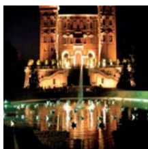
Castello di Agliè