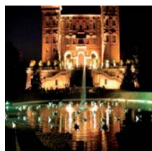
Castello di Agliè