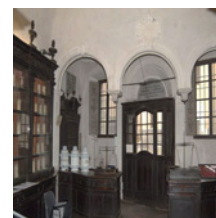
Antica Spezieria di San Giovanni Evangelista Antica Spezieria di San Giovanni Evangelista Antica Spezieria di San Giovanni Evangelista