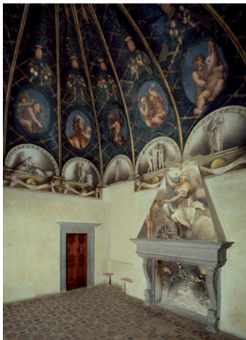
Camera di San Paolo

L'attuale percorso museale della Camera di San Paolo ricostruisce gli ambienti dell'appartamento privato della badessa Giovanna da Piacenza, all'interno dell'antico monastero benedettino femminile di San Paolo, che all'inizio del Cinquecento fu uno dei centri culturali più significativi della città.