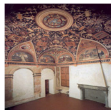
Camera di San Paolo