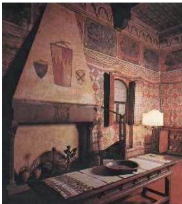
Interno del Museo

Acquistato dallo Stato nel 1951, Palazzo Davanzati fu inaugurato nel 1956 come Museo della Casa Fiorentina. Le decorazioni parietali trecentesche imitanti drappi appesi, i pavimenti in cotto, i soffitti di legno, i camini, gli arredi antichi, gli oggetti di uso comune, il pozzo che si apre ai diversi piani, gli agiamenti (gabinetti), la cucina, la collezione di merletti e di ricami illustrano la vita domestica di una ricca casa fiorentina tra XIV e XVIII secolo.