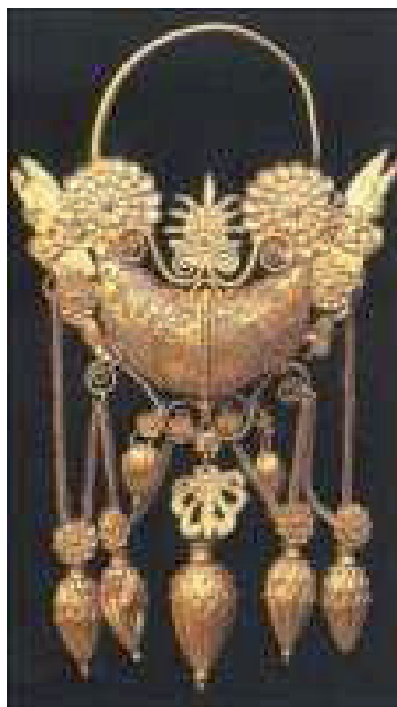
orecchino in oro

Il Museo Nazionale Archeologico di Taranto è fra i più importanti d'Italia e fu istituito nel 1887. Il Museo occupa fin dalle origini l'ex Convento dei Frati Alcantarini, costruito a metà del XVIII secolo e, in seguito ad interventi di ingrandimento a metà del XX secolo, l'adiacente corpo settentrionale dell'Ala Ceschi. A partire dal 1998 sono iniziati i lavori di ristrutturazione che hanno portato alla parziale riapertura al pubblico del Museo, avvenuta il 21 dicembre 2007. Attualmente è visitabile il primo piano che ospita le collezioni greche, romane e apule, tra cui alcuni degli ori che hanno reso celebre il Museo in tutto il mondo.