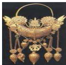
orecchino in oro