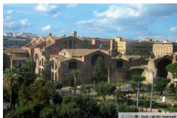
Terme di Diocleziano

Le Terme di Diocleziano sono il più grandioso impianto termale mai costruito a Roma. Erette tra il 298 e il 306 d.C., avevano un'estensione di oltre 13 ettari e potevano accogliere fino a 3000 persone contemporaneamente, in un percorso che si snodava tra palestre, biblioteche, una piscina di oltre 3500 metri quadrati e gli ambienti che costituivano il cuore di ogni impianto termale: il frigidarium, il tepidarium e il caldarium. Proprio queste ampie sale furono trasformate da Michelangelo per la realizzazione della Basilica di Santa Maria degli Angeli e dei Martiri Cristiani: negli altri ambienti delle Terme sorse, ideato dallo stesso artista, il Convento dei Certosini.