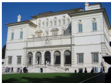
Roma, Galleria Borghese

Conserva sculture, bassorilievi e mosaici antichi, nonché dipinti e sculture dal XV al XVIII secolo. La raccolta, costituita inizialmente dal cardinale Scipione Borghese all'inizio del XVII secolo, conserva capolavori di Antonello da Messina, Giovanni Bellini, Raffaello, Tiziano, Correggio, Caravaggio e splendide sculture di Gian Lorenzo Bernini e del Canova.