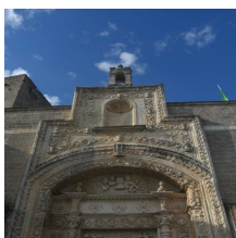
Portale di ingresso