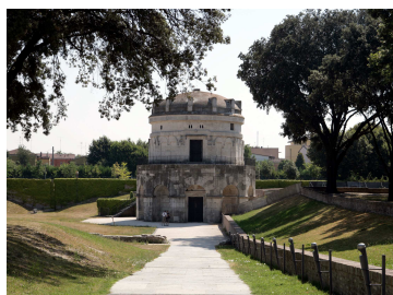
Esterno del Museo

Il Mausoleo di Teodorico fu eretto verso il 520 d.C., ancora vivente il re Teodorico, nell'area sepolcrale gota. La costruzione decagonale, in grandi blocchi squadrati di pietra aurisina, consta di due celle sovrapposte. L'ordine superiore, arretrato, è concluso da una cornice circolare decorata da un fregio. Il monumento è ricoperto da un monolite di eccezionali dimensioni, con dodici modiglioni a doppio spiovente.