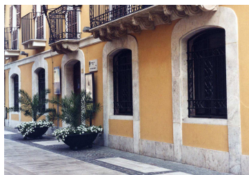
Esterno del Museo

Il museo "Casa Natale di Gabriele d'Annunzio" occupa il primo piano dell'edificio dove nacque e trascorse la sua infanzia il Poeta e conserva ancora l'atmosfera originale ottocentesca, con le sue eleganti decorazioni parietali e i suoi arredi d'epoca, che ritorna nella sua opera sotto forma di visioni, impressioni e ricordi, legati soprattutto alla forte valenza che per lui avevano gli affetti familiari. La visita ripropone la successione delle prime cinque stanze, che costituiscono il nucleo originario della casa-museo, per ognuna delle quali è riportata la descrizione che il Poeta ne fa nel Notturmo. Le successive sono state destinate all'esposizione di foto, documenti, libri, calchi e cimeli rappresentativi della figura del Poeta.