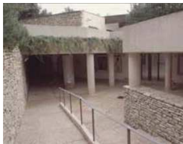
Ingresso del Museo

Il museo, situato all'ingresso delle "grotte di Catullo", fu aperto al pubblico nel 1999 in un edificio di recente costruzione, con lo scopo di sostituire il piccolo antiquarium che raccoglieva parte dell'attuale collezione. Nel museo sono esposti materiali rinvenuti nella villa e nell'area del Garda, raccogliendo le testimonianze della parte più antica della cittadina lombarda, dagli oggetti recuperati dalle palafitte sommerse lungo le coste della penisola a quelli rinvenuti più recentemente negli scavi di età romana e medievale. Il museo espone inoltre la pianta dell'edificio romano, la documentazione fotografica degli scavi, alcuni mosaici, vari oggetti in bronzo e ceramica, alcuni mosaici pavimentali. Nel Museo è presente una postazione con monitor touch screen, in cui sono proiettati filmati e percorsi virtuali con ricostruzioni in 3D ("Palafitte, ville romane, castelli. Visita ai siti archeologici del Garda occidentale"). I video multimediali sono realizzati in tre lingue (italiano/inglese/tedesco) e è possibile scegliere il percorso linguistico preferito.