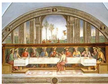
Affresco dell'Ultima Cena

Il refettorio, ornato da un affresco del Quattrocento raffigurante l'ultima Cena e sullo sfondo l'Orazione di Cristo nell'Orto, attribuito a Pietro Perugino, fu destinato a museo fin dal XIX secolo. Nel 1855 vi fu aperto il Museo Egizio, il 12 marzo 1871 il Museo Etrusco, nel 1894 la collezione Feroni. Dopo l'alluvione del 1966 è stato depositato delle opere d'arte danneggiate e quindi riaperto nel 1990, riunendo nella sala del Cenacolo anche affreschi di Bicci di Lorenzo (1430 circa) provenienti da altri locali dell'antico convento di Fuligno e un Crocifisso ligneo di Benedetto da Maiano, ormai ricollocati nell'adiacente ex convento. Attualmente il Cenacolo, nel nuovo progetto di allestimento, ospita, oltre all'Assunzione della Vergine di Valerio Marucelli, un tempo sull'altar maggiore della chiesa di Sant'Onofrio, la Crocifissione e dipinti quattro-cinquecenteschi, testimonianza della diffusione del peruginismo in Toscana e in Italia.