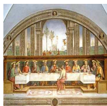
Affresco dell'Ultima Cena