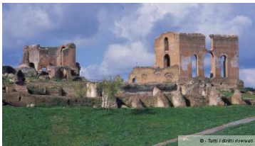
Panoramica della Villa dei Quintili

Grandiosi resti della Villa romana dei fratelli Quintili, circondati da 23 ettari di verde, all'interno del comprensorio dell'Appia Antica. Ai resti archeologici è annesso un piccolo Antiquarium che raccoglie le testimonianze più significative degli scavi recentemente condotti.